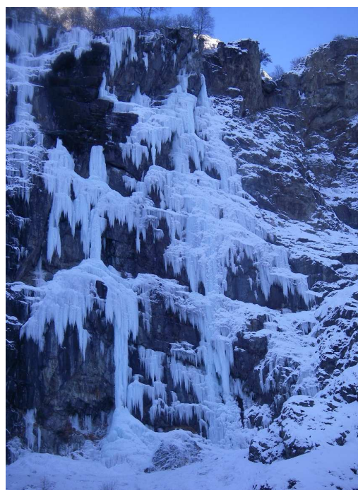
L' Etoffe des blaireaux après l'effondrement