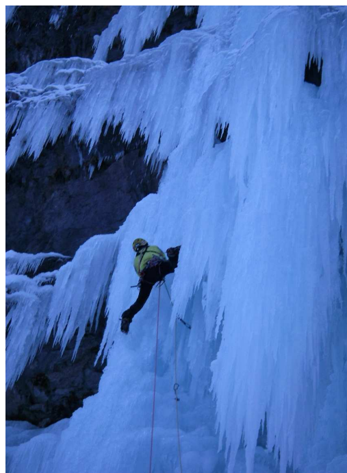
Romain dans la L1 de l' Etoffe

http://www.ffme.fr/formation/ARTICLE.php?id=3057