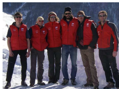
L'équipe Midi-Pyrénées sur son 31