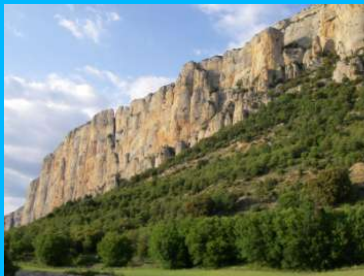
Paret de Catalunya (Montrebei)