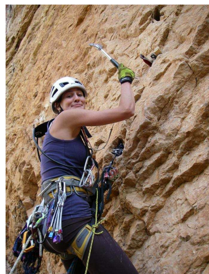
Claire s'en donne à cœur joie