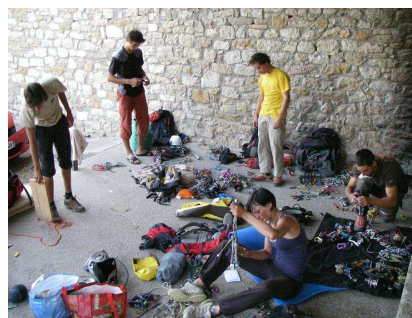
Tri du matériel...